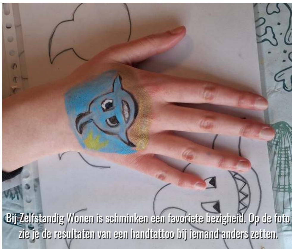
Bij Zelfstandig Wonen is schminken een favoriete bezigheid. Op de foto zie je de resultaten van een handtattoo bij iemand anders zetten.